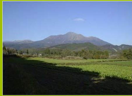
宮崎神宮の参道沿いにある“ケレン状”の積み石（左）と霧島高千穂の峰