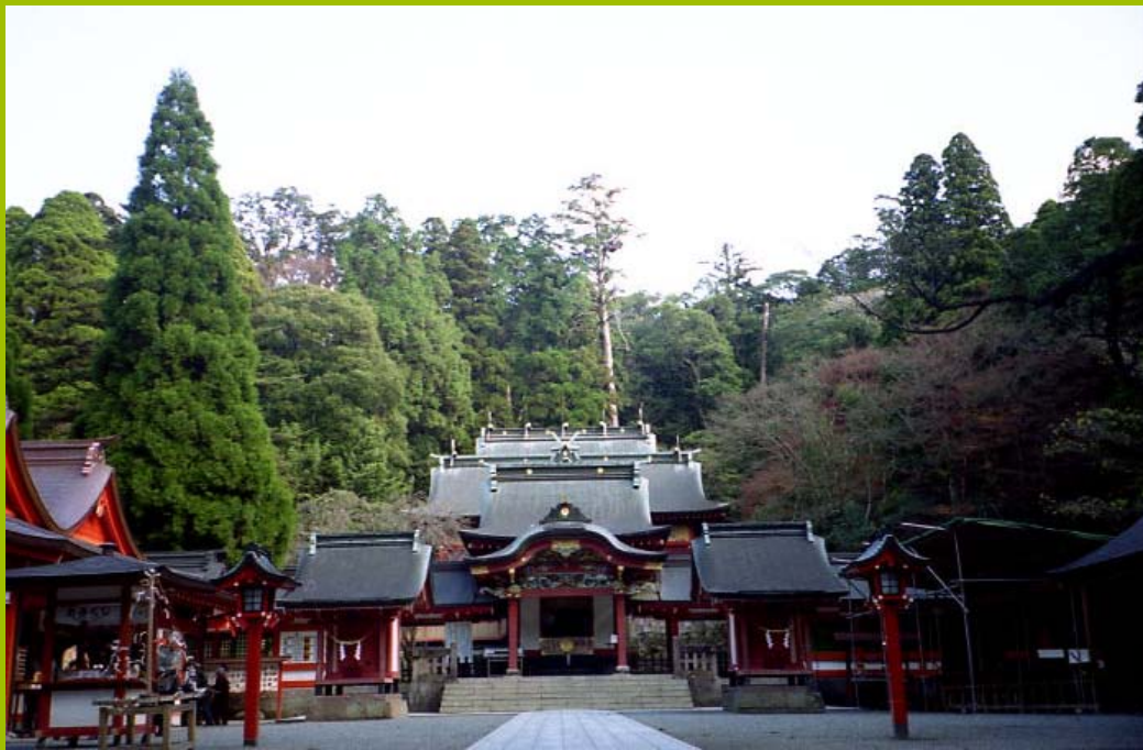
霧島神社…その造りは比較的華やかである…南国の香りがするような… 上の古地図で分かるように、霧島神社自体は錦江湾、すなわち海に向かっている。霧島神社および高千穂の峰の御鉢だけは、鹿児島県に属する。