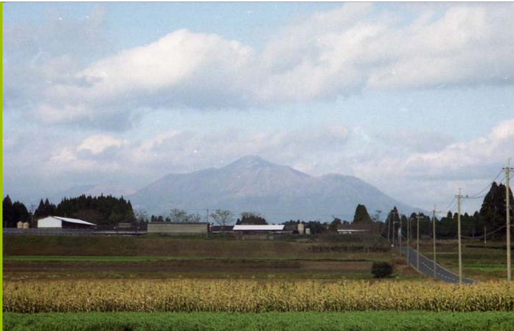
風景；霊峰高千穂その1