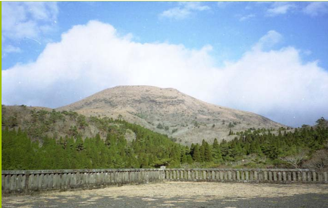
霧島連山にある中岳（1332m） 高千穂の峰の御鉢から西北に中岳、新燃岳、韓国岳、えびの高原と続く。