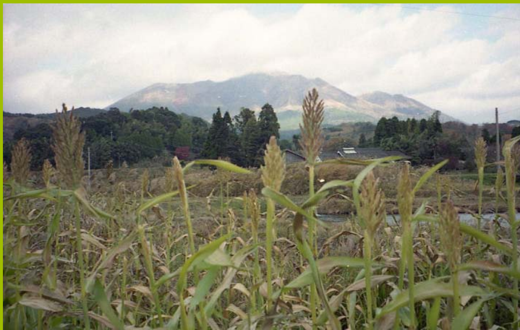
風景；霊峰高千穂その2