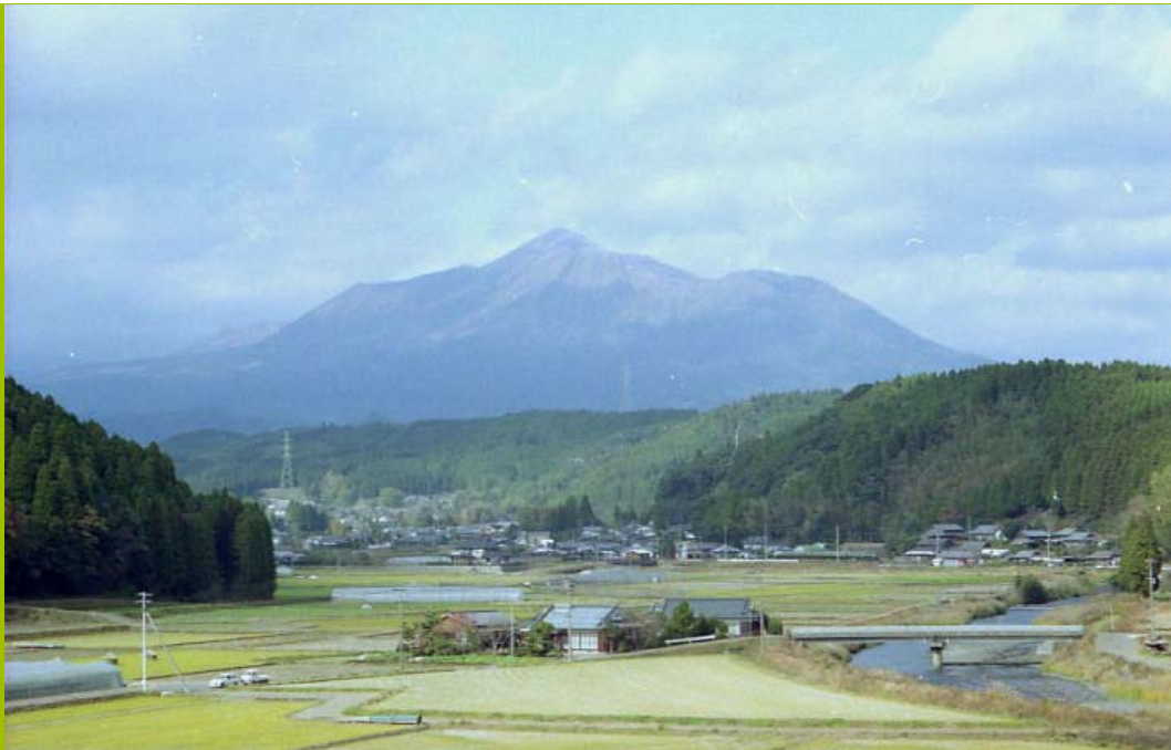
風景；霊峰高千穂その3