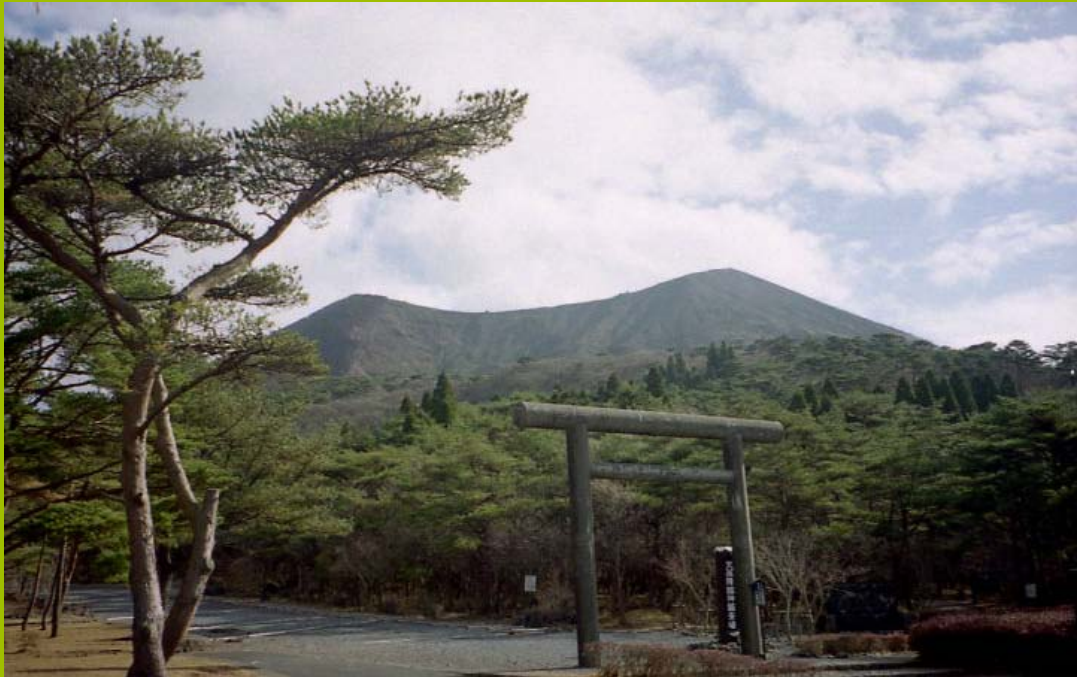
霧島神宮古宮跡（鹿児島県）の鳥居と参道

御系譜…天祖天照大神（伊勢神宮）-天忍穗耳尊（英彦山神宮）-天孫瓊瓊杵尊（霧島神宮） -彦火火出見尊（鹿児島神宮）-鵜葺草葺不合尊（鶴戸神宮）-神日本磐余彦尊（宮崎神宮）